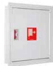
PV-142 ja upotuskehys

Kaappien vakiovärit harmaa (RAL 7040), valkoinen (RAL 9016) ja punainen (RAL 3020). ■ □ ●