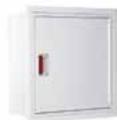
PV-10 ja upotuskehys