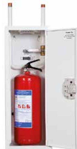
PV-57 SV ja sammutin Sammutimet sivulta 21.