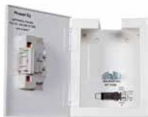
PV-7 IV Mini