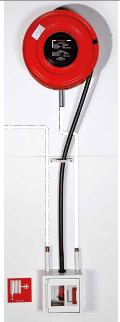
PV-23 letkukela ja PV-7 SV pilariposti