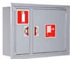
PV-102 ja upotuskehys