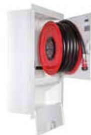
PV-202 ja upotuskehys

Kaappien vakiovärit harmaa (RAL 7040), valkoinen (RAL 9016) ja punainen (RAL 3020). ■ □ ●