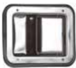
PV-Lukkolaite, RST Tukeva lukkolaite RST-kaappeihin