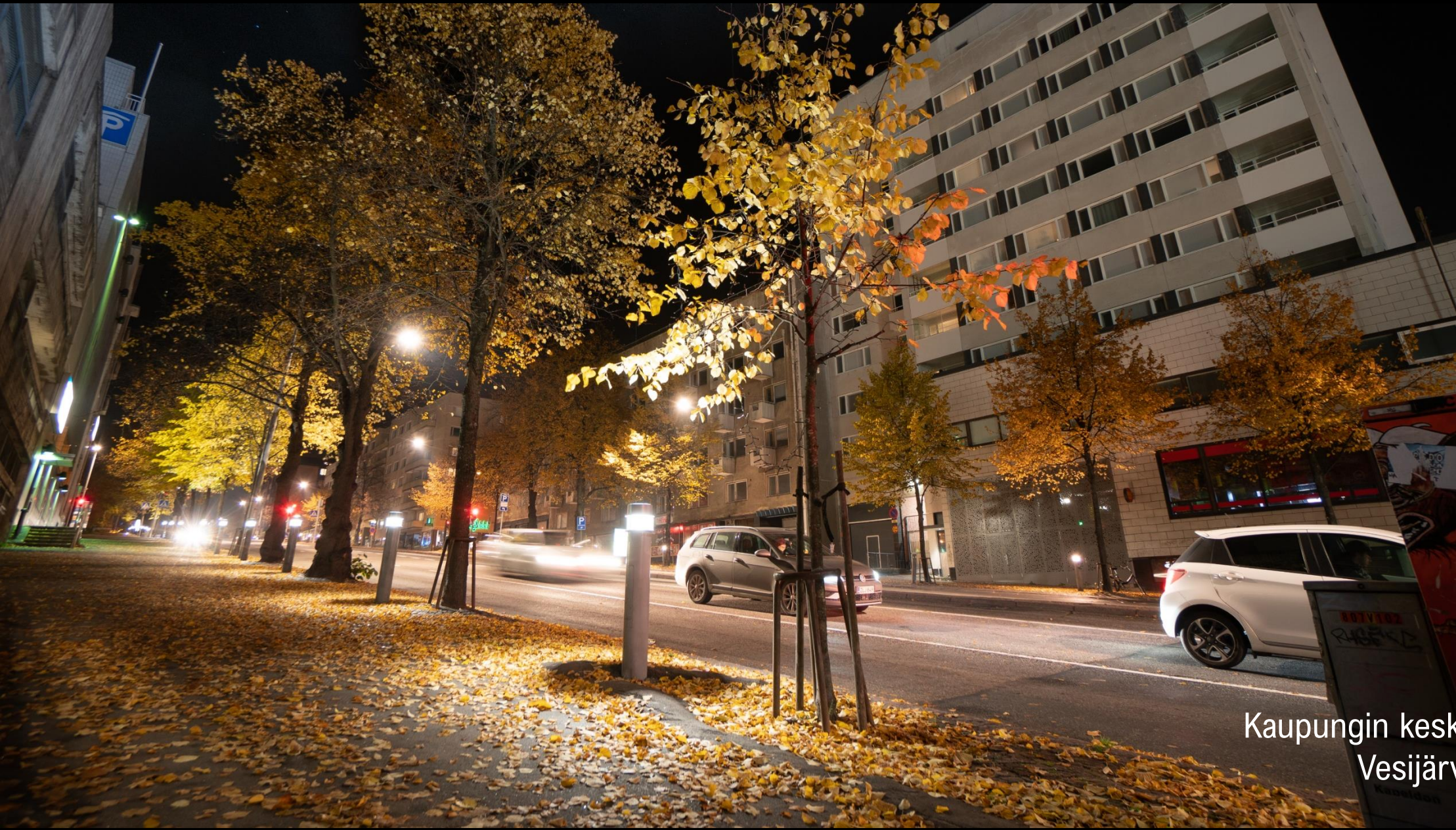
Kaupungin keskustassa Vesijärvenkatu, Lahti