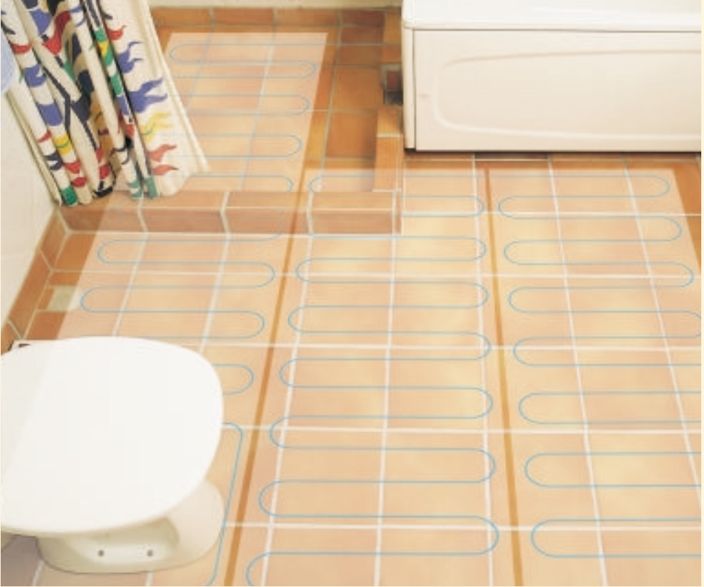
T2QuickNet-elementillä vältät kylmän lattian pesuhuoneessa.

Nyt voit helposti välttää kylmän klinkkerilattian pesuhuoneessa. T2QuickNet on uusi tapa asentaa lattialämmitys nimenomaan klinkkerilattiaan. Lämpökaapeli on valmiiksi kiinnitetty 500 mm leveään kaapelimattoon. Matto on kevyesti itsekiinnittyvä koko pinnastaan joten liimaa tai kiinnikkeitä ei yleensä tarvita . T2QuickNet on hyvin ohut ja korottaa lattiaa ainoastaan 3 mm. Matto voidaan tasoitteeseen sijoitettuna asentaa kaikkien lattiamateriaalien päälle. T2QuickNet lämpömatto on erittäin helppo asentaa. Liimapinnan ansiosta se pysyy kätevästi paikoillaan. Matossa on ainoastaan yksi syöttökaapeli, joten loppupäättä ei tarvitse tuoda takaisin syöttöpisteeseen. Nopeaa ja helppoa!