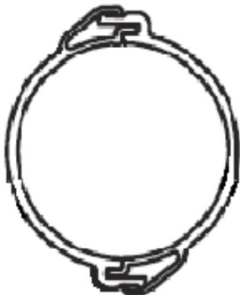
Liitokset pystysuunnassa SN 8 (Luokka B)

Putkien valmistus tapahtuu EN 50086-2-1 ja EN 50086-2-4 sekä EBR –standardien mukaisesti. Halkaistujen putkien rengasjäykkyys SFS 5608 mukaisesti määräytyy liitoksenteon suunnan perusteella: