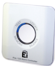
EI450 Langaton etäohjain Yhteensopiva RadioLINK-langattomiin EI160-sarjan ja EI208WD varoittimiin. Snr. 71 379 40