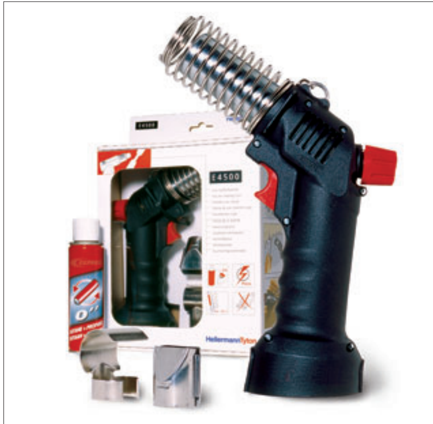
Kaasulla toimiva kuumailmapuhallin E4500.

Kaasupatruunat saatavana myös erillisesti, nimikenumero 391-90100, tuotetunnus P444, Snro 64 072 56. Pakkauskoko 12 kpl.