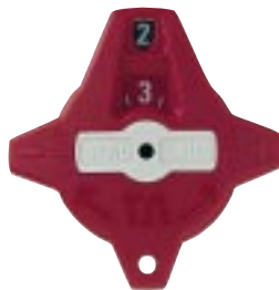
Kuva 2. Auki 2,3 kierrosta