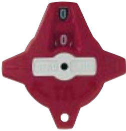
Kuva 1. Kiinni oleva venttiili