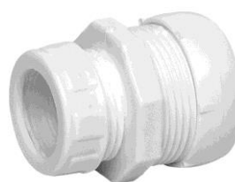
25mm x 32mm, lukitusmutteri LVI 248 8187 // FP 75200