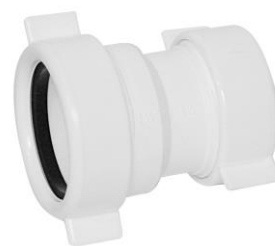
32mm x 40mm, lukitusmutteri LVI 248 8185 // FP 76000