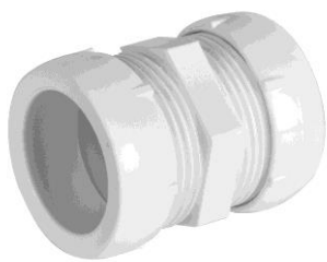
32mm x 32mm, kartiomutteri LVI 248 8183 // FP 75600