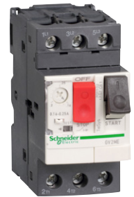
GV2ME moottorinsuoja- katkaisija