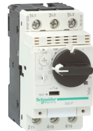
GV2P moottorinsuoja- katkaisija