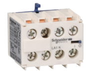
LA1KN apu- kosketinlohko