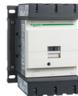
LC1D115- LC1D150 kontaktori