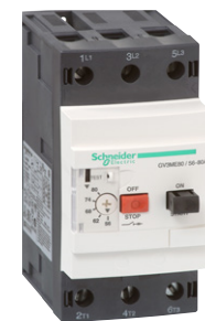
GV3ME moottorinsuoja- katkaisija