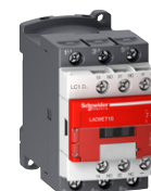
LAD9ET1S punainen kansi