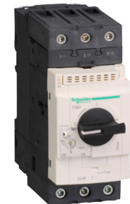
GV3P moottorinsuoja- katkaisija