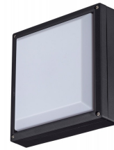
Satela Square LED

Asennusreikien ja läpivientien sijainnit: