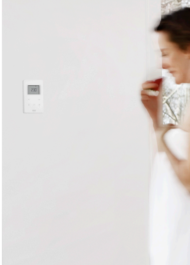
Touchline huonetermostaatti on vain 19,5 mm paksu. Termostaattia on saatavana myös mustana.

Roth on kehittänyt sovelluksen Touchlineen, jotta asiakkaasi voivat säädellä koko lattialämmitysjärjestelmää iPhonesta – olivatpa he sitten Savonlinnassa tai San Franciscossa. Sovelluksen voi ostaa App Storesta. Lattialämmitysjärjestelmää voi luonnollisesti ohjata myös tietokoneelta Internetin kautta. Järjestelmän ohjelmistopäivitykset tehdään SD-kortin kautta.