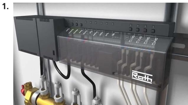
Kiinnitä ohjausyksikkö ja kytke termomootorit.

Touchlinen avulla huonetermostaatien asennus sujuu erittäin helposti. Vain kaksi painallusta ja olet periaatteessa valmis.