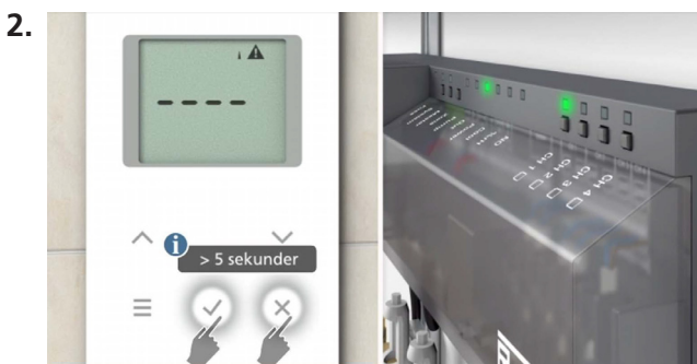
Valitse ohjausyksikön kanava ja ilmoita huonetermostaatti.