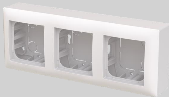
Pintakotelo, 3-osainen 85 mm Syvyydet: 43 ja 53 mm