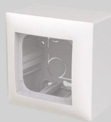
Pintakotelo, 1-osainen 85 mm Syvyydet: 43 ja 53 mm