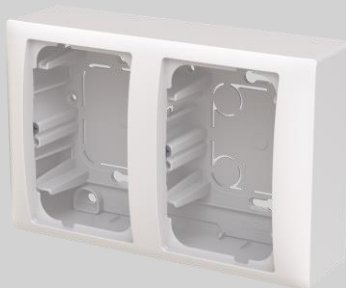
Pintakotelo, 2-osainen 100 mm Syvyys: 48 mm