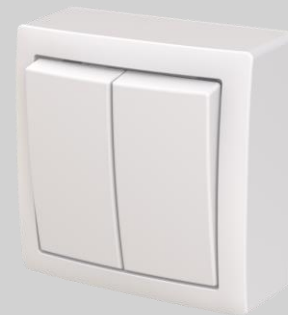
5- kytkin / 6+6-kytkin