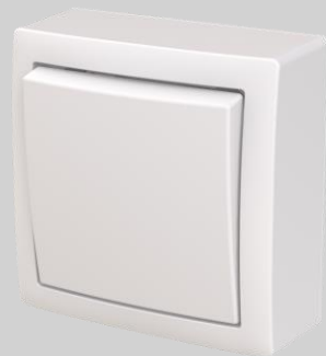
6- kytkin / 7-kytkin