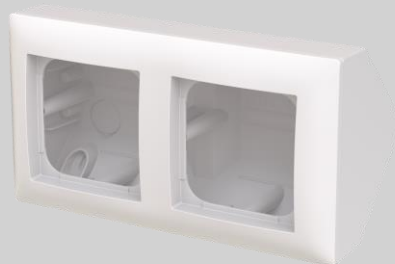
Pintakotelo, kulma- asennus