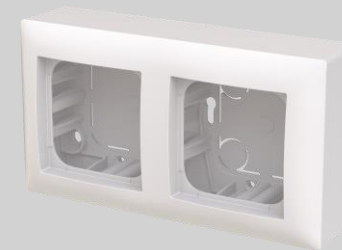
Pintakotelo, 2-osainen 85 mm Syvyydet: 43 ja 53 mm