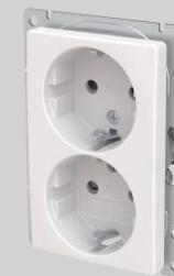
2-pistorasia matala 2506471