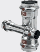
Temponox ristiyhde sis. SC-Contur - ruostumaton teräs - puristusliitännät Varustus EPDM tiivisteet Huomautus Ei sovellu käyttövesiasennuksiin! Malli 1748