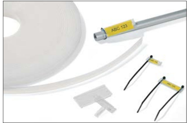
Helafix HC- ja HCR-merkintäprofiilit.