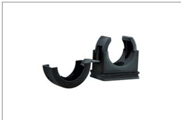
PACC - suojaletkukiinnike.