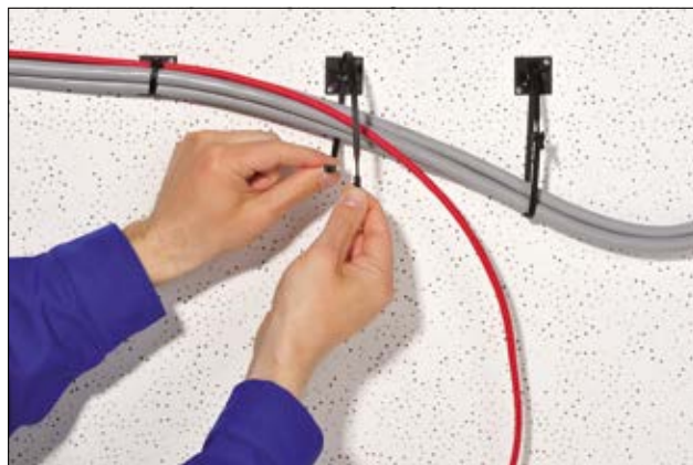
Q-sarjan johdinsiteet soveltuvat myös tilapäiseen sidontaan.