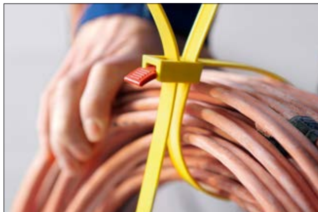
Johdinsiteen loppuosa pujotetaan lukko-osan silmukan läpi.