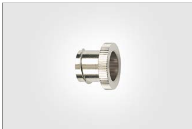
LTS-EI - suojaletkupäätte.