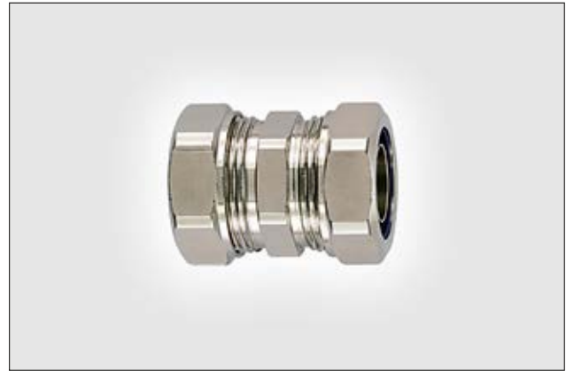
LTS-LTS - suojaletkun jatkoliitin.