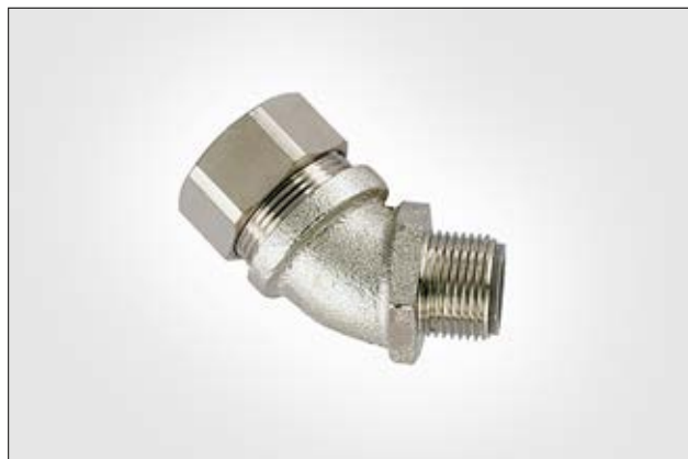
LTS-45FMC - 45°-suojaletkuliitin, kiinteä ulkokierre.