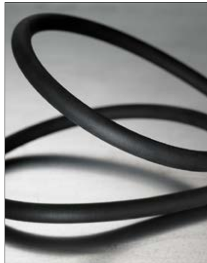
LTSH - halogeenivapaa nestetiivis terässuojaletku.