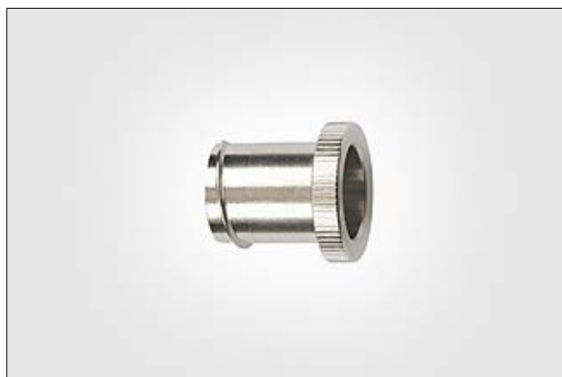
PCS-EI - suojaletkupäätte.