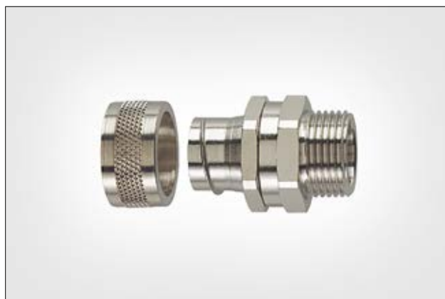
PCS-SM - suora suojaletkuliitin, pyörivä ulkokierre.