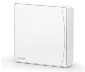
Danfoss Icon2™ Sensor 088U2120