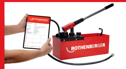
Testiprotokollan luominen sovelluksen avulla