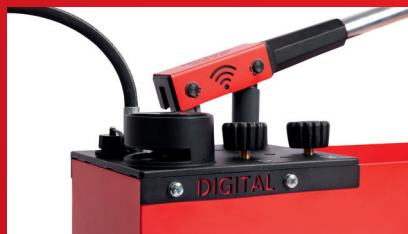
Testitietojen langaton lukeminen Bluetooth® kautta