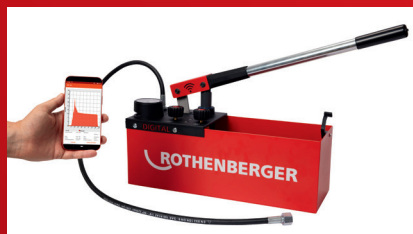
Digitaalinen paineanturi mahdollistaa tarkan testipaineen tarkan säädön