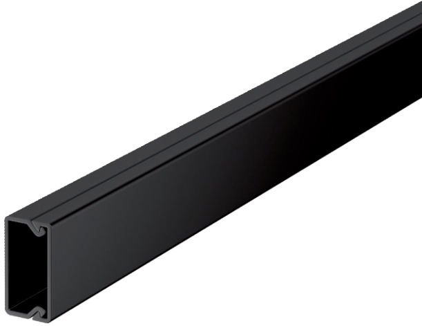
Kanavan kansi ja kanava, Pohjareijitys