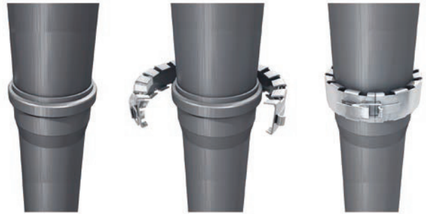
Wavin LKS -muhvilukon asennus.

Muhvilukkoja voidaan käyttää kaikkien kolmen Wavin-kiinteistöviemärin kanssa (Wafix HT/PP, AS+ ja SiTech+).