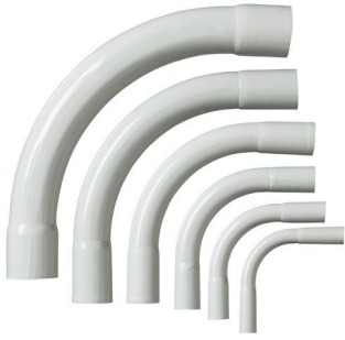
01 Halogeenivapaat muoviputken kaaret