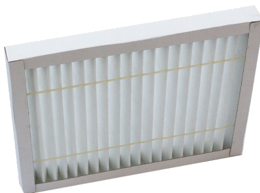
Versione non standard Not standard version