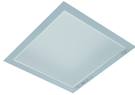
Best Clean A / Best Clean C