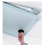
Best Clean imukuppi.