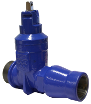
Talosulkuventtiili ulkokierre muhvi-sisäkierre