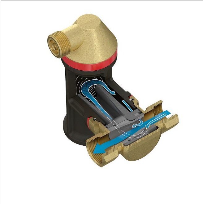
Selection table for Flamcovent & Clean Smart series