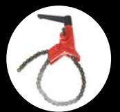
Erittäin vahva 6" ketjutuki