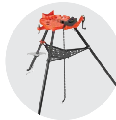
460-12 Siirrettävä TRISTAND ketjupuristin Luettelo No. 36278