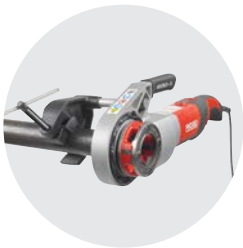
690-I Käsikierrekone Luettelo No. 44933

VISIT RIDGID.EU FOR MORE CUTTING & STEEL PIPE FABRICATION SOLUTIONS