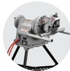
975 Combo rulla-ura laite Luettelo No. 33033