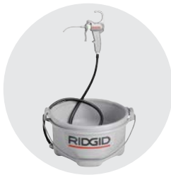
418 öljy-astia Luettelo No. 73442